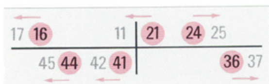
Gambar 3 Index Periodontal Ramfjord