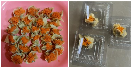
Gambar 3.1 Dimsum bahan dasar sarden dan bayam

Setelah menentukan formulasi untuk membuat dimsum berbahan dasar ikan sarden dan sayur bayam, selanjutnya dilakukan uji organoleptik yang dilakukan oleh 30 panelis tidak terlatih untuk melihat daya terima dimsum. Uji organoleptik yang dilakukan meliputi warna, aroma, rasa, dan tekstur. Uji organoleptik yang dilakukan menggunakan parameter warna, aroma, rasa dan tekstur dengan skala hedonik skor 1-5 dengan kategori sangat tidak suka, tidak suka, agak suka, suka, dan sangat suka. Uji organoleptik dilakukan terhadap tiga formula dimsum ikan sarden dan sayur bayam dengan kode sampel F1, F2, dan F3.