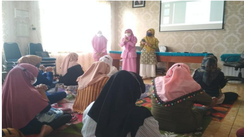
Gambar 7. Praktik hypnosis pelatihan ke-2