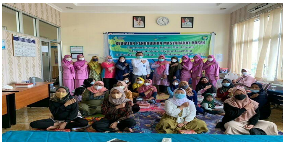
Gambar 3. Peserta Pelatihan ke-2