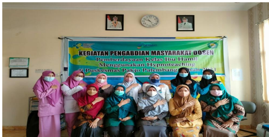
Gambar 2. Peserta Pelatihan ke-1