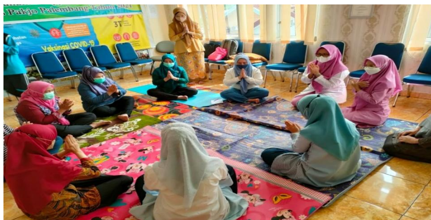
Gambar 6. Praktik hypnosis pelatihan ke-1