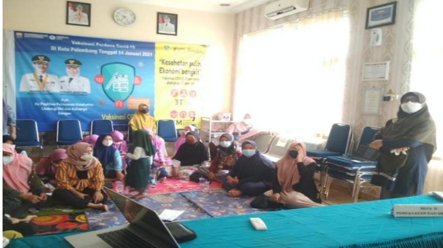
Gambar 4. Penyampaian materi oleh pengabdi

Oktober 2021, peserta pelatihan sebanyak 20 orang. Tanggal 21 Oktober 2021, pelaksanaan pelatihan ke-2. Acara diawali dengan sambutan kepala Puskesmas Pakjo Palembang, bapak Asnawi SKM., M.Kes, dilanjutkan dengan pemaparan materi tentang kelas ibu hamil dan hypnosis oleh pengabdi. Pengelola kelas ibu hamil melakukan hypnoteaching kepada peserta kelas ibu hamil. Setelah peserta kelas ibu hamil tersugesti, pengelola menyampaikan materi di kelas ibu hamil yaitu; materi tentang kehamilan, persalinan, nifas, perawatan bayi baru lahir. Acara pelatihan selesai pukul 12.00 wib, ditutup dengan penyerahan booklet hypnoteaching dari pengabdi kepada bidan koordinator puskesmas, pemberian bahan kontak kepada peserta pelatihan dan foto bersama pengabdi dan peserta pelatihan